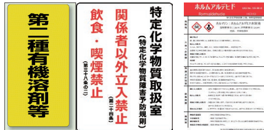
▲揭示A ▲揭示C ▲揭示D